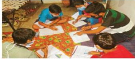
शिखा : बच्चों को पढ़ाते हुए स्वयंसेवक।

इस वैश्विक महामारी कोरोना काल में संपूर्ण देश में स्कूल और